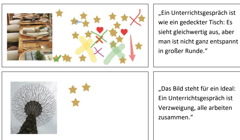
Abbildung 1: Bildassoziation zu „Unterrichtsgespräch“ (eigene Darstellung mit Fotos von Mat Brown/Pexels, oben, und Kat Bautista/1millionfreepictures, unten)

Um allen Teilnehmer*innen zu Beginn einen gemeinsamen Einstieg zu ermöglichen, haben wir ein niedrigschwelliges Partizipationsangebot konzipiert: Die Studierenden sehen vier Bilder und sollen sich überlegen, welches Bild ihrer Einschätzung nach am besten zur Situation eines Unterrichtsgesprächs passt. Jede*r setzt einen sogenannten „Stempel“ bei dem Bild, das der eigenen Vorstellung am ehesten entspricht. Zu jedem Bild können einzelne Studierende ihre Assoziation äußern oder in den Chat schreiben. Zwei Beispiele: