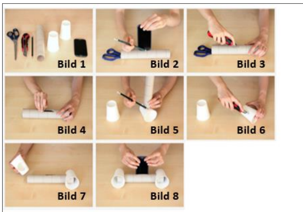
Abbildung 1: Bilder zu der Schreibaufgabe Smartphone-Lautsprecher

Aufgabe: Beschreibe anhand der Bilder in einem Text genau den Bau des abgebildeten Smartphone-Lautsprechers, sodass jemand diesen Smartphone-Lautsprecher nachbauen kann, ohne die Bilder zu sehen.