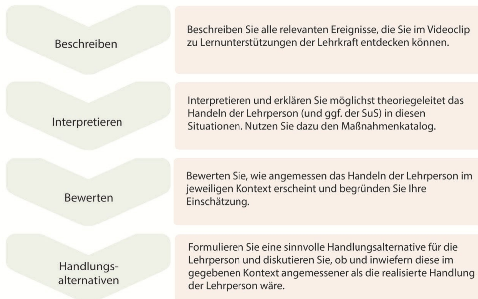
Abbildung 1: Einheitliche Arbeitsaufträge für die Videoanalysen im Sinne des vierstufigen Analyseschemas der professionellen Unterrichtswahrnehmung

Die Auswahl der Videosequenzen für die Lehrveranstaltung erfolgt im Vorfeld schrittweise in einem Event-Sampling-Verfahren , indem zusammenhängende Unterrichtssituationen identifiziert werden, die lernunterstützende Maßnahmen beinhalten oder in denen entsprechende Maßnahmen wünschenswert wären (Petko, Haab & Reusser, 2003). Auf diese Weise kann eine Vorauswahl potenzieller Videoszenen getroffen werden. Diese wird kriterienbasiert (in Anlehnung an Kersting, 2008; Meschede, 2014; Seidel & Prenzel, 2007) weiter selektiert. Berücksichtigt werden dabei Kriterien wie beispielsweise eine Länge des Unterrichtsclips von drei bis fünf Minuten, das Vorhandensein möglichst vieler Lernunterstützungsmaßnahmen, sowohl gelungene als auch teilweise kritische Unterrichtssituationen sowie die Vielfalt an Unterrichtsthemen. Die getroffene Vorauswahl wird von einem internen Expert*innenteam (bestehend aus Akteur*innen aller Phasen der Lehrerbildung) weiter gefiltert, um aus dieser Vorauswahl Unterrichtsclips für die Lehrveranstaltung auszuwählen. Auf diese Weise wird eine Vielfalt an unterschiedlichen Jahrgangsstufen, Schulformen sowie geographischen Themenschwerpunkten repräsentiert. Dabei werden verstärkt geographische Lerninhalte ausgewählt, für die sich Schüler*innen in der Regel weniger interessieren, um die Berücksichtigung der Heterogenitätsdimension Interesse im Geographieunterricht zu verdeutlichen. Dazu gehört zum Beispiel das Thema Landwirtschaft (Hemmer & Hemmer, 2010).